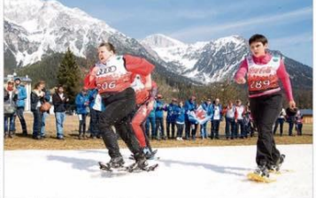
Die Special-Olympics-Fahrer aus Luxemburg feiern ihren Erfolg bei den Weltwetterspielen in Schladming. Im Hintergrund: Die Teilnehmerinnen bei den Paralympics in Rio de Janeiro.

Luxemburgs Special-Olympics-Team freut sich über 16 Medaillen bei den Weltwetterspielen